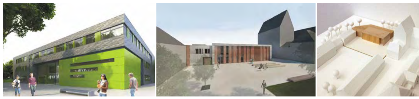
Visualisierungen: Ostfalia FH Salzgitter | Domäne Marienburg Hildesheim | Modellfoto: Domäne Marienburg Hildesheim

Thiemo Pesch: „Bildungsbauten sind eben nicht irgendwelche Gebäude. Hier werden Menschen motiviert, hier müssen Gedanken fließen und die Phantasie angeregt werden.“