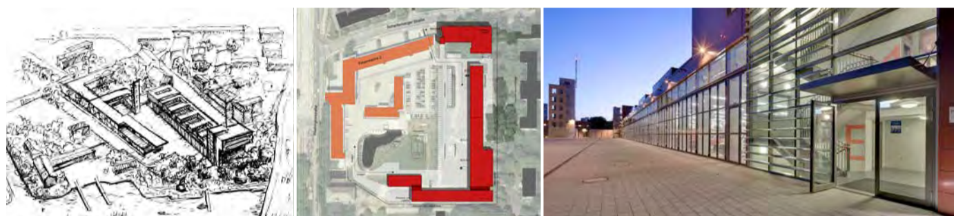
Skizze: Hauptfeuerwache Potsdam | Lageplan: Brand- und Katastrophenschutzzentrum Dresden