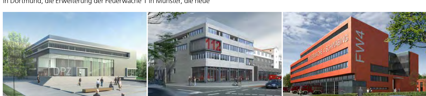
Visualisierungen: DPZ Göttingen | Feuerwache Münster | Feuerwache 4 München

Eine Wechselseite der agn-Niederlassung Halle geben. Informationen zu Termin und Ort folgen.